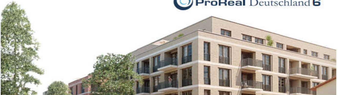
Illustration: bogevichs buero architekten & stadtplaner GmbH

Wohnraum schaffen in deutschen Metropolen